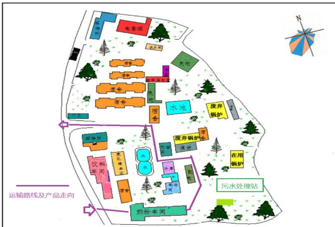
图2.1-3云南新希望邓川蝶泉乳业有限公司老厂区运输路线图 (产品走向)